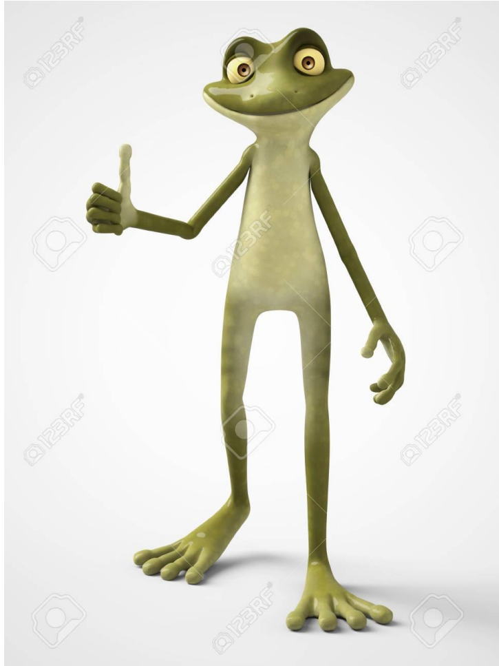
CROQUIMAN Y MR.KIWI

MR.KIWI Y CROQUIMAN SE LLEVABAN MUY BIEN, EN CAMBIO, CROQUIMAN Y LA SOMBRA NO ERAN TAN AMIGOS.