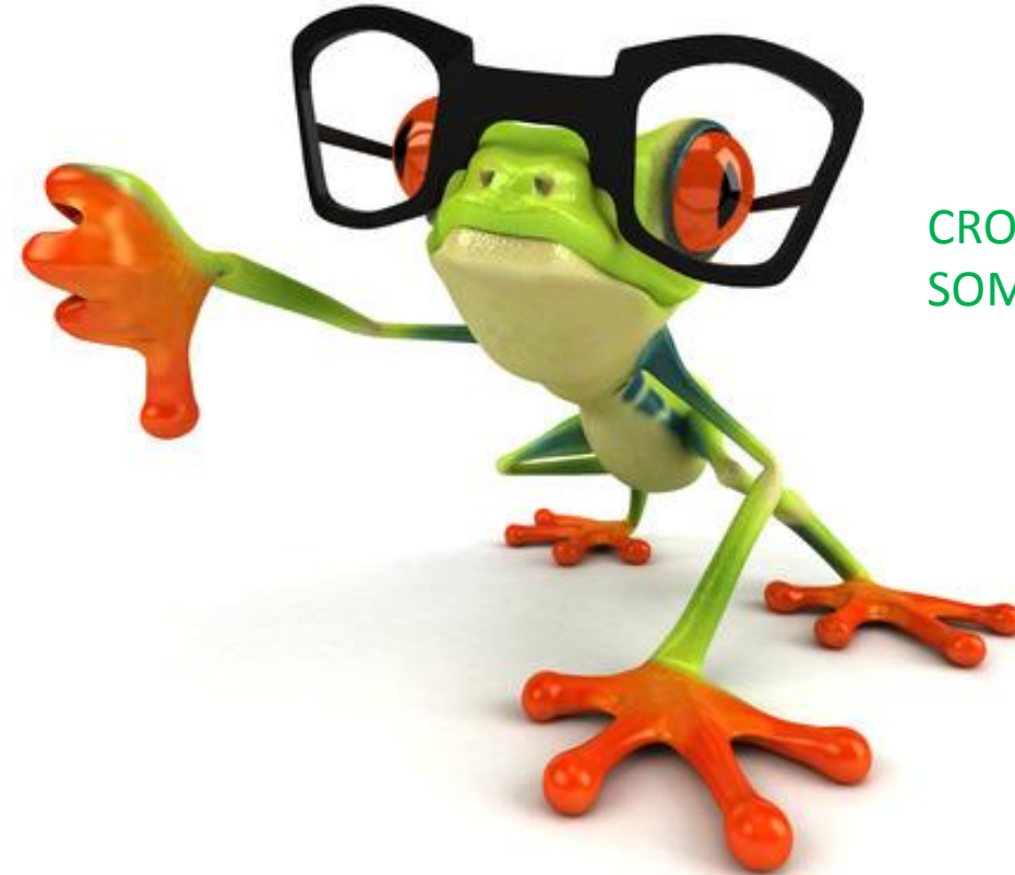
CROQUIMAN Y LA SOMBRA